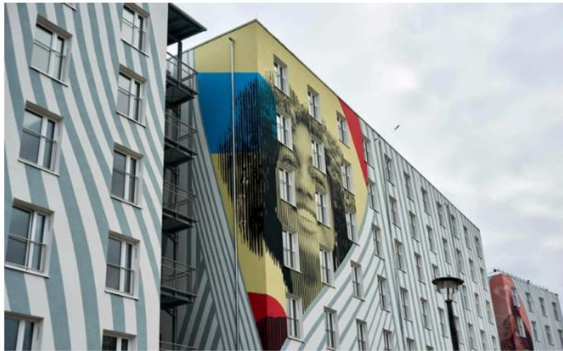
Neubau eines Studentenwohnheims in Berlin: Der neue Invesco-Fonds vergibt Kredite an nachhaltige Immobilienprojekte.

Der Immobilien-Investmentmanager Invesco Real Estate legt seinen ersten europäischen Immobilienkreditfonds auf. Bei dem Invesco Commercial Mortgage Income – Europe FCP RAIF handele es sich um einen offenen Fonds mit einem Zielvolumen von zunächst einer Milliarde Euro, teilte der Anbieter mit. Die Kapitalzusagen stammen hauptsächlich von Versicherungsunternehmen, heißt es.