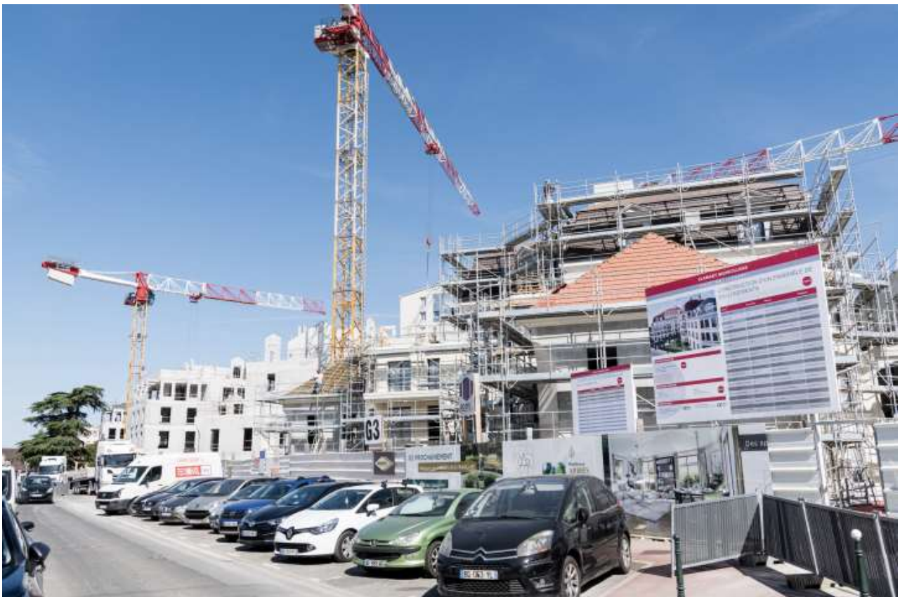
IMMEUBLE EN CONSTRUCTION À CLAMART

Quelle classe d'actifs finançant à la fois l'économie réelle et la transition énergétique est susceptible de profiter d'un environnement de hausse des taux ? La dette immobilière est une réponse. Le choix dans ce domaine vient de s'étoffer avec le lancement par le gérant d'actifs américain Invesco de son premier fonds de dette immobilière en Europe.